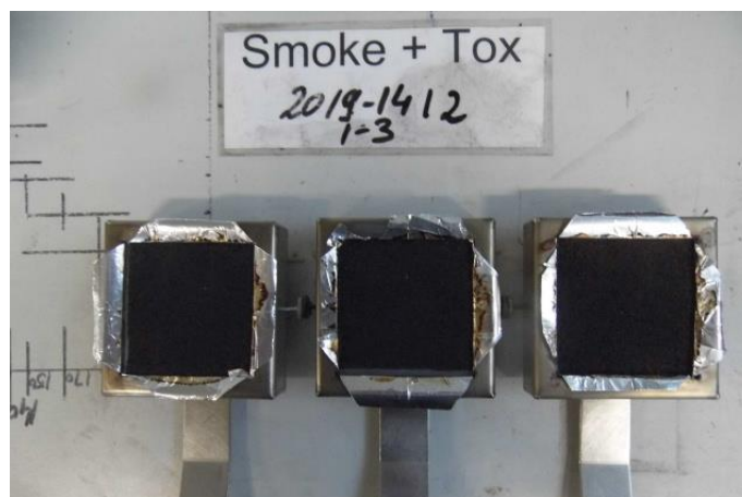
Aussehen der Proben nach dem Rauchdichteversuch Appearance of the specimen after the smoke test