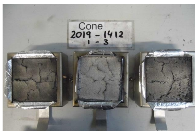
Aussehen der Proben nach dem Cone Versuch Appearance of the specimen after the cone test