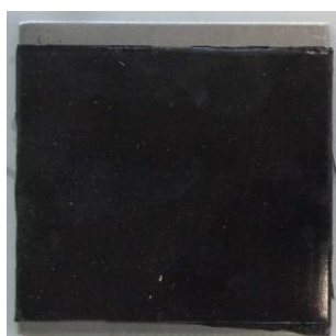
Vorderseite / Prüfseite der Proben Front side / test side of the specimen

Aussehen der Proben vor dem Versuch Appearance of the specimen before the tests