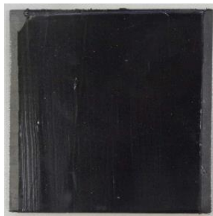
Vorderseite / Prüfseite der Proben Front side / test side of the specimen

Aussehen der Proben vor dem Versuch Appearance of the specimen before the tests