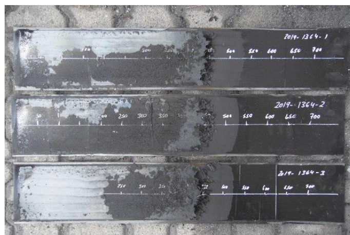
Aussehen der Proben nach dem Spread of Flame Versuch Appearance of the specimen after the spread of flame test