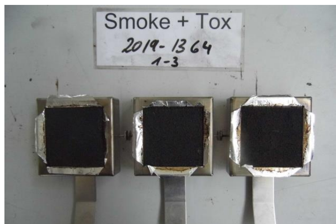
Aussehen der Proben nach dem Rauchdichteversuch Appearance of the specimen after the smoke test