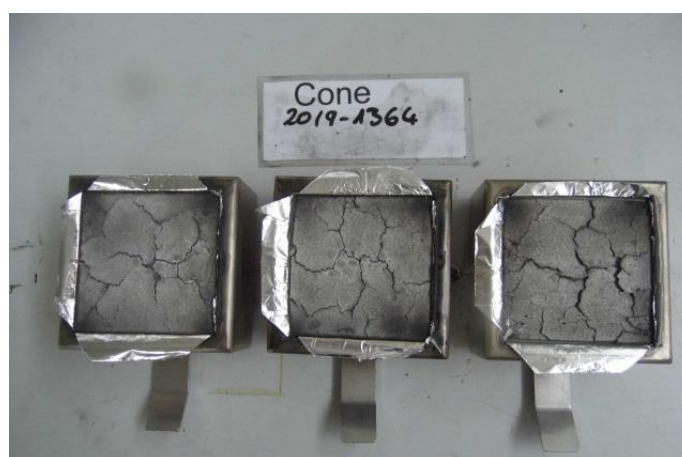
Aussehen der Proben nach dem Cone Versuch Appearance of the specimen after the cone test